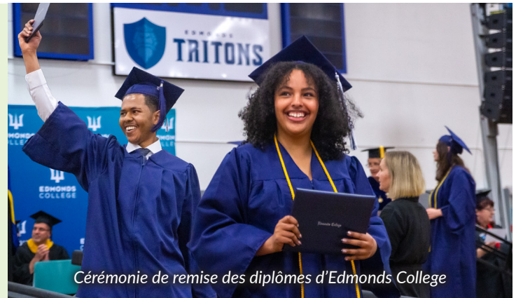
Cérémonie de remise des diplômes d'Edmonds College