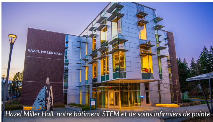
Hazel Miller Hall, notre bâtiment STEM et de soins infirmiers de pointe