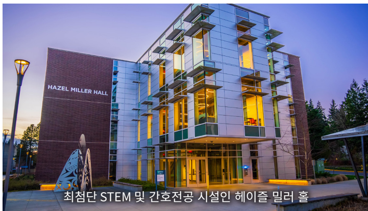
최첨단 STEM 및 간호전공 시설인 헤이즐 밀러 홀