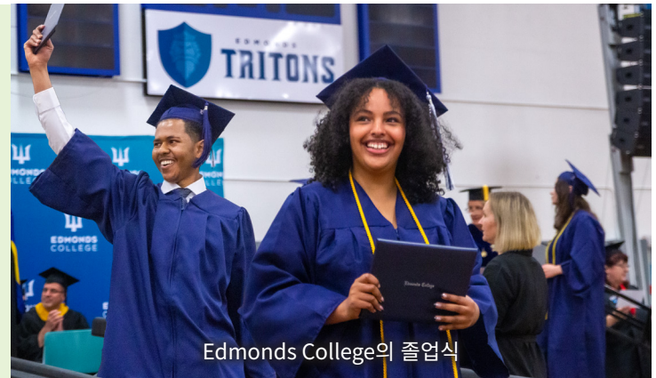
Edmonds College의 졸업식